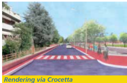
Rendering via Crocetta

Lippo è una delle frazioni al centro di un progetto di riqualificazione che, dopo la piazza, interessano ora via Crocetta. Sono infatti in corso i lavori, peraltro ri-