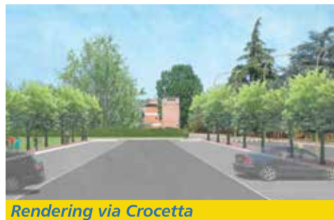
Rendering via Crocetta

messo in sicurezza dall'installazione di un semaforo, così da permettere ai cittadini di accedere direttamente all'area golenale San Vitale entrando da via Aldina. ■