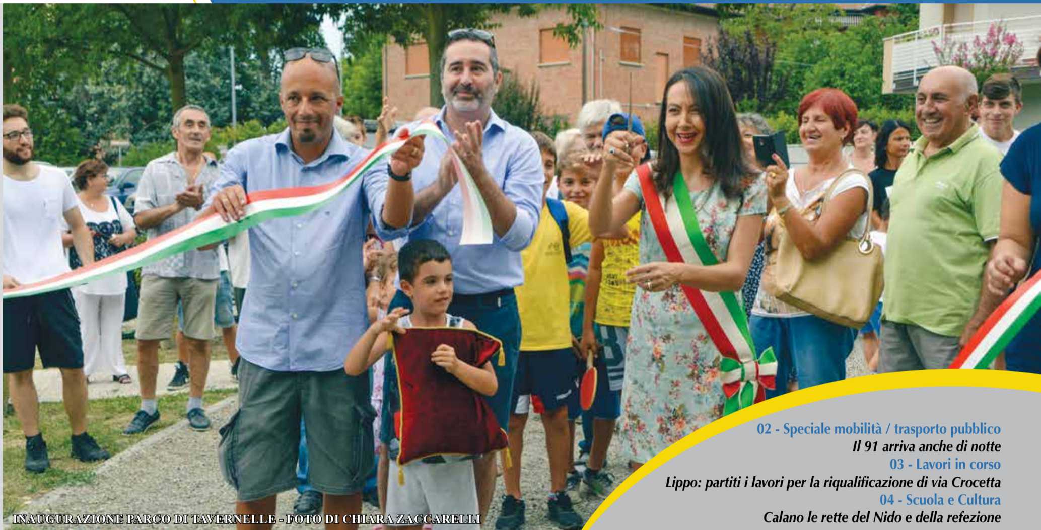
INAUGURAZIONE PARCO DI TAVERNELLE

NOTIZIE CALDERARA | Aut. Trib. di Bologna n. 5414 del 16/10/86 | Direttore Responsabile: Barbara Tucci Redazione: Comunicazione e Ufficio Stampa | Direzione: Piazza Marconi 7 - Calderara di Reno - Tel. 051.64.61.111 - www.comune.calderaradieno.bo.it Impaginazione e Raccolta Pubblicitaria: Eventi soc. coop. - Tel. 051.634.04.80 - eventi@eventibologna.com - www.eventibologna.com Stampa: MIG | Tiratura: 6.300 copie | chiuso il 09/09/2018