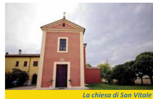
La chiesa di San Vitale

San Vitale, il martire schiavo, morì a Bologna tra la fine del terzo e l'inizio del quarto secolo insieme al suo proprietario Agricola: entrambi erano stati fatti oggetto di persecuzione, ma avevano portato avanti il loro credo in Cristo fino alla morte. Il loro culto fu fortemente voluto da Ambrogio, vescovo di Milano, che aveva apprezzato soprattutto il fatto che i due, profondamente amici, si fossero presentati al martirio nella stessa condizione, e non in quella di padrone e schiavo. Oggi Calderara istituzionalizza il suo culto per il "Santo bolognese", e fino al 4 novembre 2020 vivrà momenti pubblici di riflessione e informazione dedicati alla figura