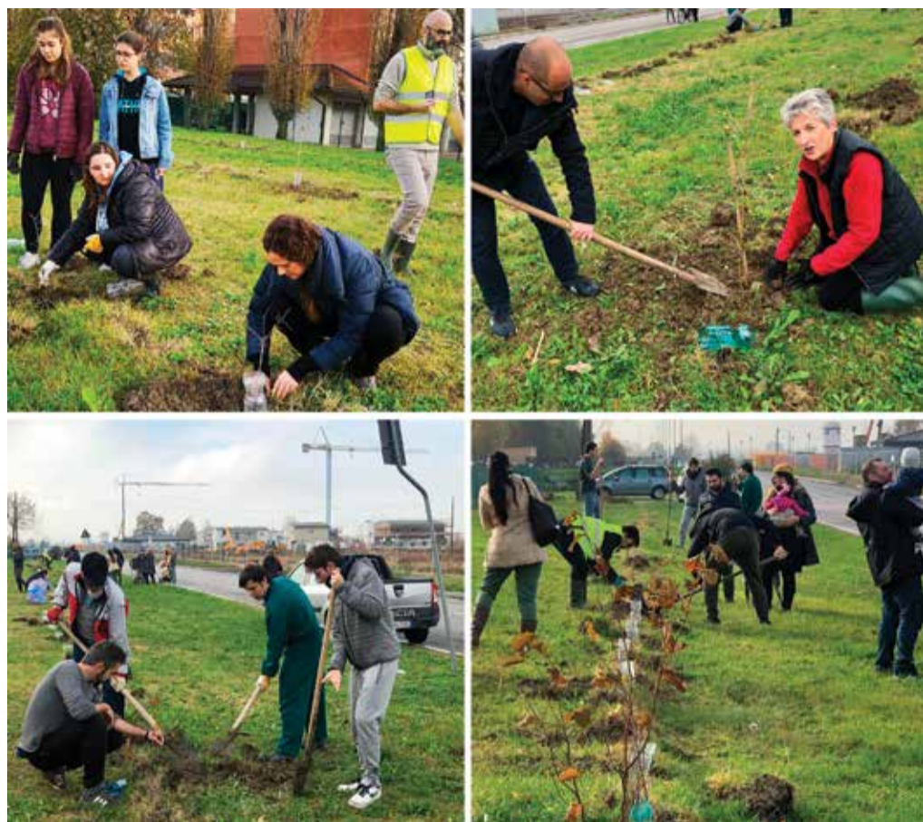
La festa dell'albero del 24 novembre

Centosette buone ragioni per rispettare l'ambiente. Tanti sono i nuovi nati in nome dei quali è stata celebrata quest'anno la grande festa dell'albero. Calderara, come tanti Comuni del territorio, ha aderito con entusiasmo all'invito della Città Metropolitana, della Fondazione Villa Ghigi e dell'associazione italiana direttori e tecnici pubblici giardini: ha sposato i valori cardini dell'iniziativa, che ha visto quasi cento eventi in due settimane di festa, e ha piantato i primi semi di quello che sarà il Bosco dei bambini.