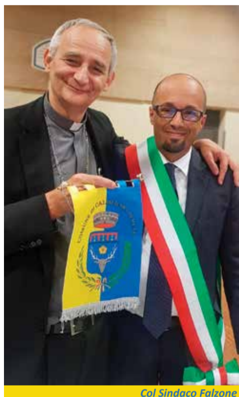
Col Sindaco Falzone

Il programma della visita di Matteo Maria Zuppi è composito e strutturato, dall'incontro alla Casa della Cultura del 12 fino alla Messa del Pederzini, alle 10,30 di domenica 15. In mezzo, un fitto calendario di incontri con associazioni, famiglie, enti e realtà di Calderara di Reno e Sala Bolognese. Si parte, dunque, venerdì 12 con l'accoglienza, fissata per le 18,45, alla Casa della Cultura "Italo Calvino", presente il consiglio comunale di Calderara. A seguire, Zuppi si sposterà tra le varie realtà dei due centri, di cui incontrerà tutti i sacerdoti alle 8 di venerdì 13 nella canonica di Sacerno, per poi visitare il centro Bacchi e le scuole elementari e materne di Calderara. Sabato 14 alle 9,30 un importante momento d'incontro con la comunità islamica di Calderara, all'hotel Gate 7, e nel pomeriggio una serie di attività nella parrocchia di Longara. La chiusura solenne domenica 15, quando il Cardinale celebrerà la Messa nel palazzetto dello sport del centro Pederzini. ■