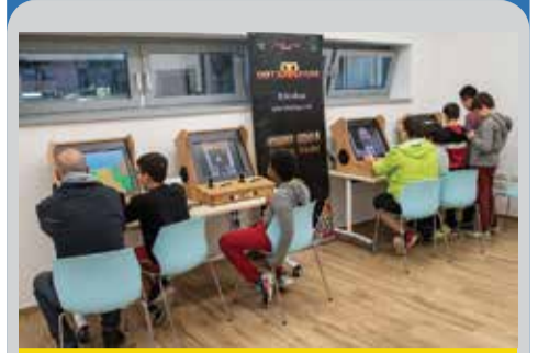
La sala giochi di BOOM

Quattro giorni di proposte per tutte le generazioni, che hanno portato alla Casa della Cultura Italo Calvino un pubblico numeroso e vario da Calderara, Bologna e da tutta l'Area Metropolitana. BOOM Cantiere Creativo Calderara dal 24 al 27 ottobre ha esplorato il tema del gioco e lo ha fatto vivere ai partecipanti da diversi punti di vista con incontri, laboratori, spettacoli, mostre, installazioni. Curato da Cronopios, il festival BOOM - alla sua seconda edizione - rappresenta la sintesi delle attività che durante tutto l'anno si svolgono alla Casa della Cultura.