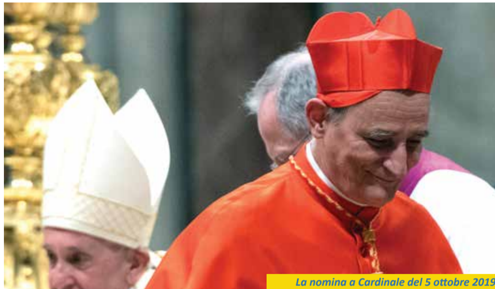
La nomina a Cardinale del 5 ottobre 2019

L'eccezionalità dell'evento, non a caso molto atteso dall'Amministrazione Comunale, è nella rilevanza della figura di Zuppi, un vescovo forse fuori dai canoni, di sicuro stimato e ascoltato anche al di fuori di am-