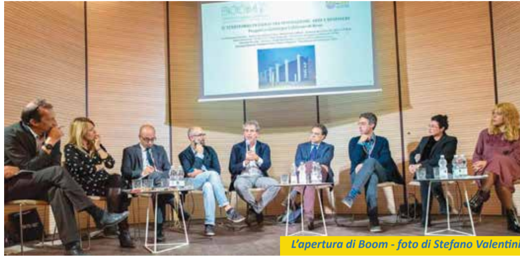
L'apertura di Boom

I piccoli centri vanno pensati nella loro forza che consiste esattamente in ciò che di solito viene considerato un limite: il loro essere piccoli e spesso lontani "dal grande supermercato dei prodotti culturali", per cui il raggiungerli deve comportare una scelta. Dopo due anni d'intenso lavoro possiamo affermare che la Casa della Cultura Italo Calvino sia un punto di riferimento per molti cittadini di Calderara che la frequentano quotidianamente e che sia stata scelta anche da un diversificato pubblico proveniente dal più ampio contesto metropolitano e regionale. L'intensa attività annuale, ricca d'incontri, mostre, presentazioni editoriali, concerti, performance, laboratori e connotata dalla qualità e originalità delle proposte, la rende un luogo vivo e vitale, uno spazio aperto, un cantiere creativo in continua evoluzione, un luogo di conoscenza, relazioni e emozioni. L'identità della Casa della Cultura assumerà in forma più specifica il carattere di Crocevia Culturale, luogo d'incontri straordinari e di progetti speciali dal forte impatto culturale e comunicativo, di Fucina Creativa nella quale tutti i giovani possano far emergere il proprio talento e acquisire strumenti e competenze fondamentali per