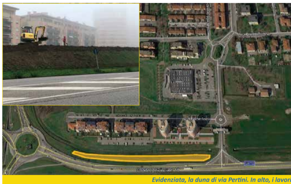
Evidenziata, la duna di via Pertini. In alto, i lavori

provinciale 18, e la zona est di Calderara, ad alta densità abitativa. Ecco, dunque, la piantumazione di 63 alberi di 5-6 metri di altezza (di 3 specie differenti), più 1790 arbusti di 13 specie. La duna riuscirà presto ad avere una protezione visiva, acustica e anti inquinamento, che risponderà alle esigenze dei cittadini. Parallelamente alla realizzazione della barriera verde, prenderà forma anche il restyling della porta di ingresso alla città, che diventerà un giardino pensile con ingresso alberato progettato dall'architetto Mario Cucinella: "La Banca di Bologna Real Estate Spa, che dovrà urbanizzare il vicino comparto con la costruzione della città giardino - dice il sindaco Giampiero Falzone -, ha raccolto la nostra ferma volontà di realizzare questo progetto come opera compensativa di forte interesse pubblico. Si tratta comunque solo dei primi di una serie di progetti, alcuni in cantiere e altri pronti ad essere realizzati: Calderara deve avere un'anima green". ■