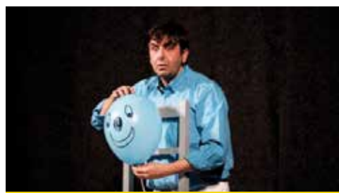
Il 2 febbraio "Storia di un palloncino"

Undici spettacoli, undici storie, undici serate o pomeriggi all'insegna del divertimento, della riflessione, della poesia. All'insegna del teatro di qualità. La nuova stagione teatrale di Spazio Reno a Calderara, che da gennaio a marzo propone un ricco programma rivolto ai bambini e alle famiglie, agli adulti e agli appassionati delle commedie dialettali, è ormai