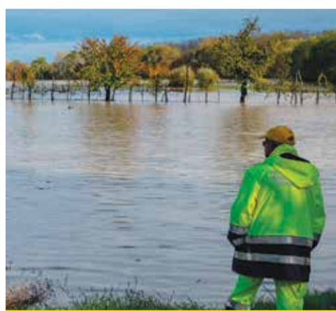
La piena del Reno del 17 novembre 2019

Anche quest'anno i Volontari della Protezione Civile hanno portato a Longara e a Calderara di Reno la campagna nazionale "Io non rischio" organizzata dal Dipartimento Nazionale di Protezione Civile e da altre associazioni tra le quali ANPAS.